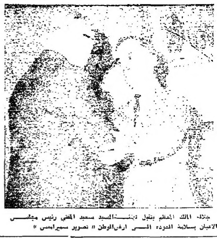
جلالة الملك الحظير يقبل فينتال السيد سعيد المضي رئيس مجلس الامانة بسلامة العودة المني ارض الوطن